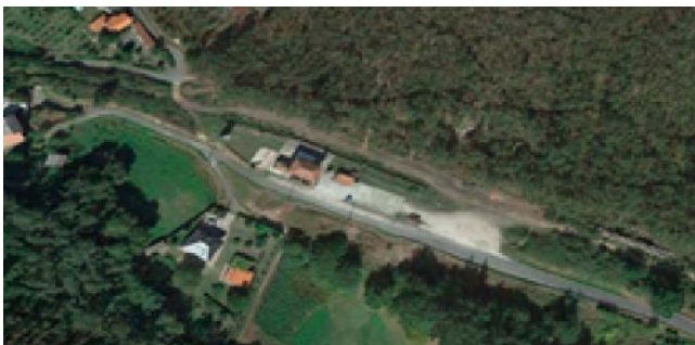
“Antigua estación” en desuso y vías desmanteladas // “Former station” not in use and tracks dismantled.