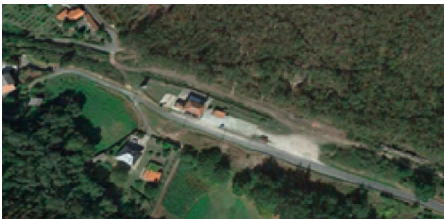
“Antigua estación” en desuso y vías desmanteladas // “Former station” not in use and tracks dismantled.