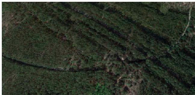
Túnel // Tunnel.